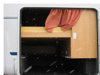
Heckgarage mit Bett „unten“