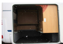
Heckgarage Bett „oben“